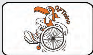
GPT – Gruppo Paraplegici Ticino www.gpticino.ch