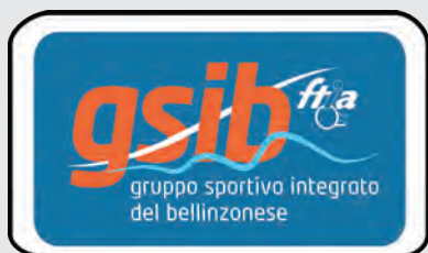
GSIB – Gruppo Sportivo Integrato del Bellinzonese www.gsib-bellinzonese.ch

chi è già membro di uno dei seguenti gruppi sportivi regionali è automaticamente anche nostro socio e non necessita di un'iscrizione individuale aggiuntiva