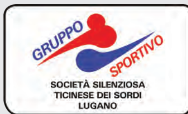
GS-SSTS – Gruppo Sportivo Società Silenziosa Ticinese dei Sordi www.ssts-lugano.com