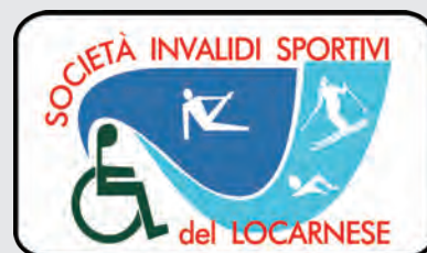
SISL – Società Invalidi Sportivi del Locarnese www.sisl-locarno.ch